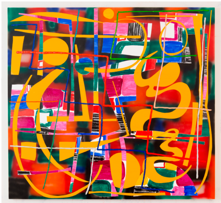
Trudy Benson, Vidimus , Ακρυλικό και λάδι σε καμβά, 155 x 168 εκ., 2018