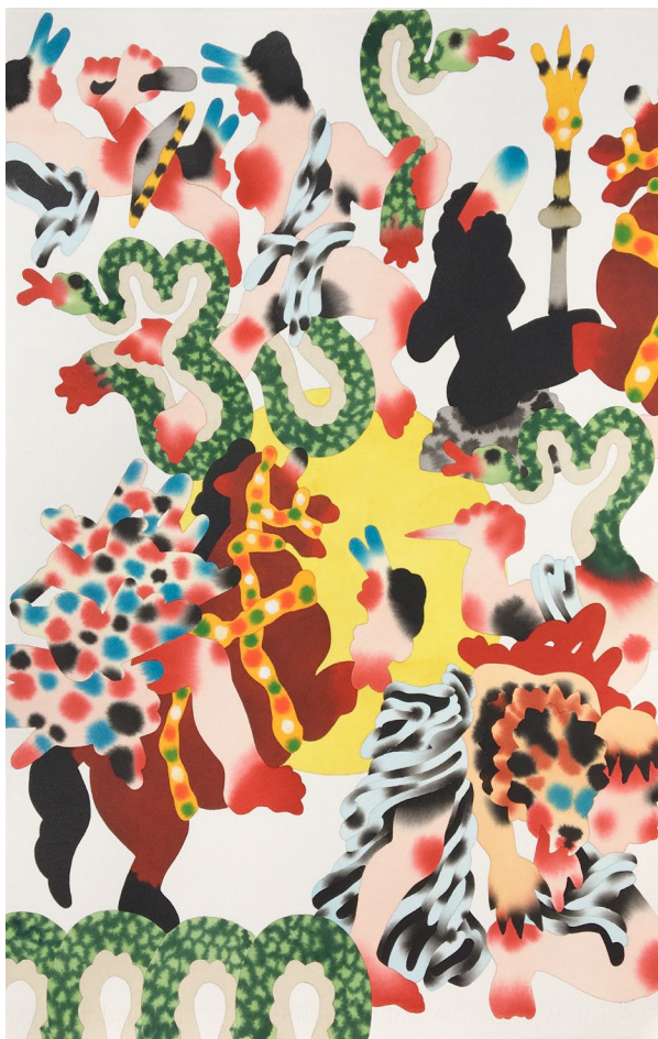
Matthew Palladino, Blood of Cronus , Νερομπογιά και μελάνι σε χαρτί, 56 x 76 εκ., 2018