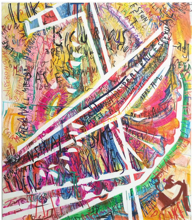
Δέσποινα Στόκου, That's the Way (Pansexual) , Λάδι ακρυλικό και χάρτινο κολάζ σε καμβά, 152 x 121 εκ., 2018