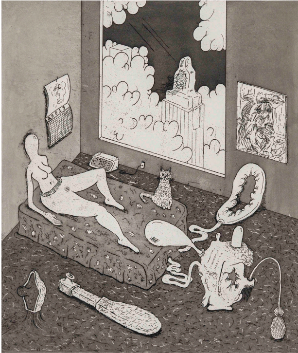
Zachary Leener, Five Etchings (Penthouse) , 2015