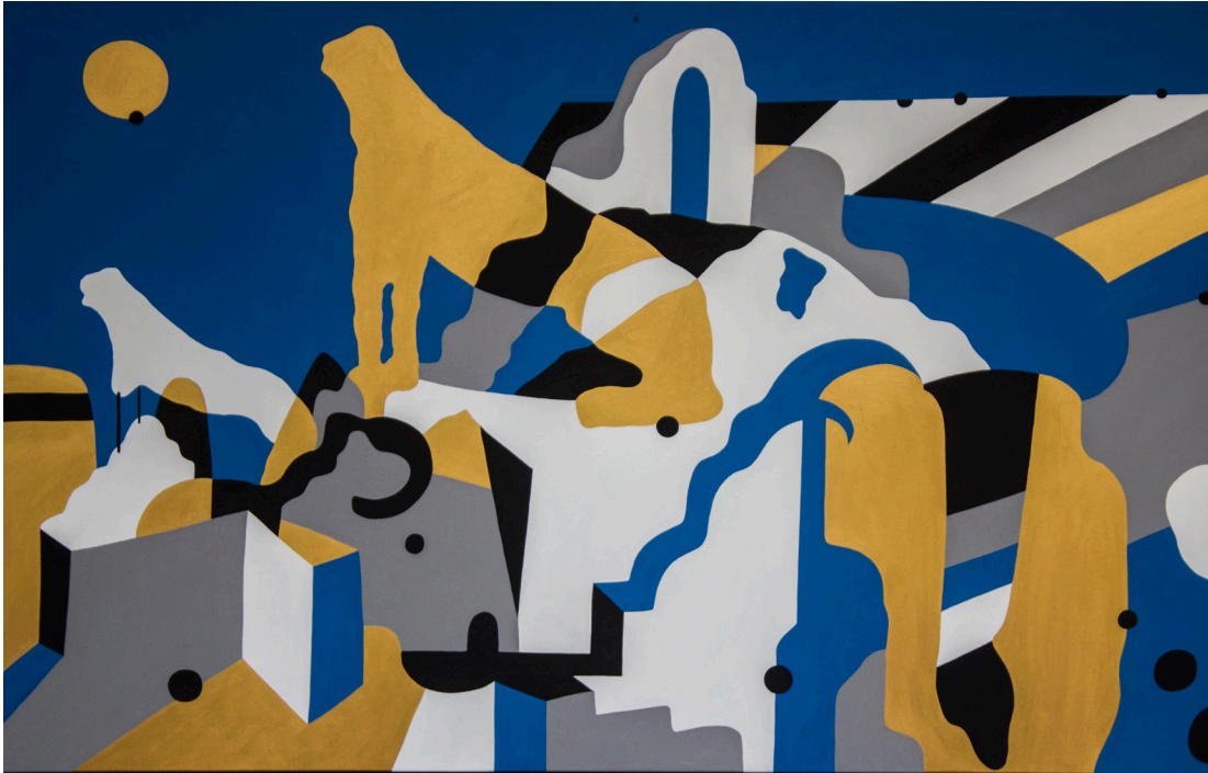
Delos - An Island I Have Never Been , ακρυλικά σε καμβά, 123 x 201 cm, 2015