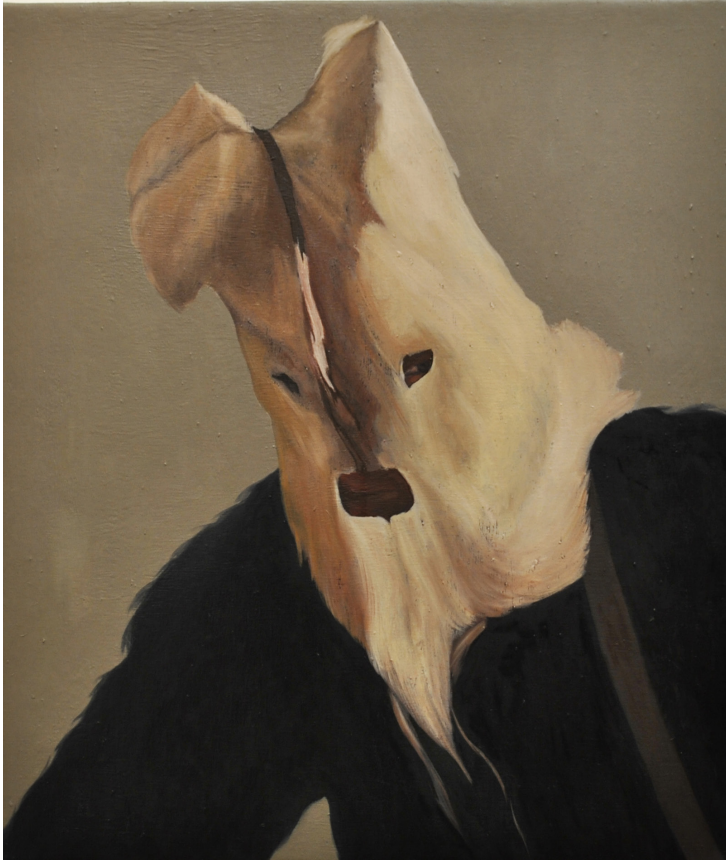
Κουδουνάς, λάδι σε καμβά, 40 x 50 cm, 2016