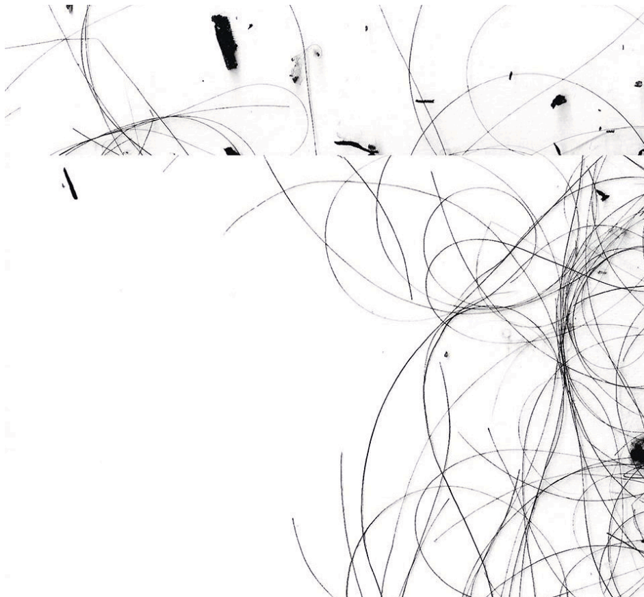
Μαρία Ευσταθίου, λεπτομέρεια του Hair I , ασπρόμαυρη εκτύπωση ζικλέ, 124 x 32 cm, 2016