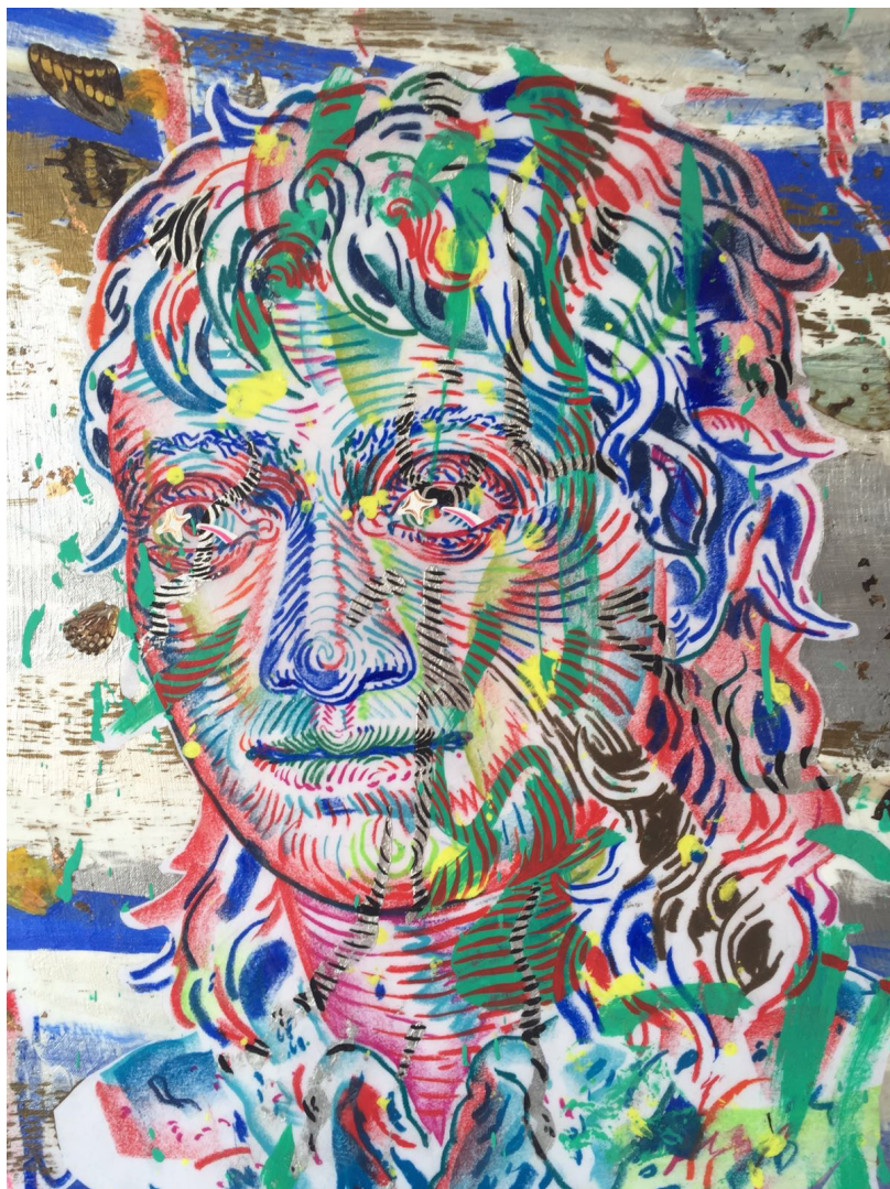
Bronzed , Acrylic, flashe, wax crayon, paper and butterflies on canvas, 70 x 50 cm, 2016