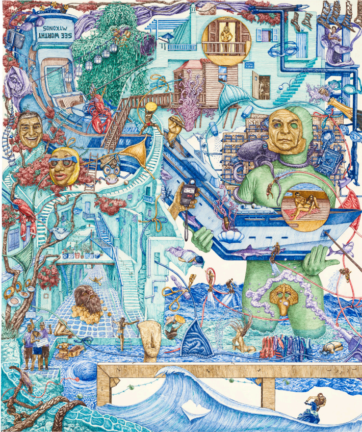
Seeworthy , ink on archival paper, 119 x 99 cm, 2016