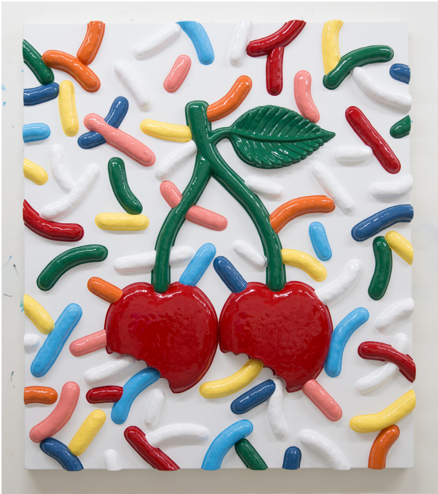
Matthew Palladino, Big Cherries , Enamel on plaster and panel, 132 x 114 x 10 cm, 2016