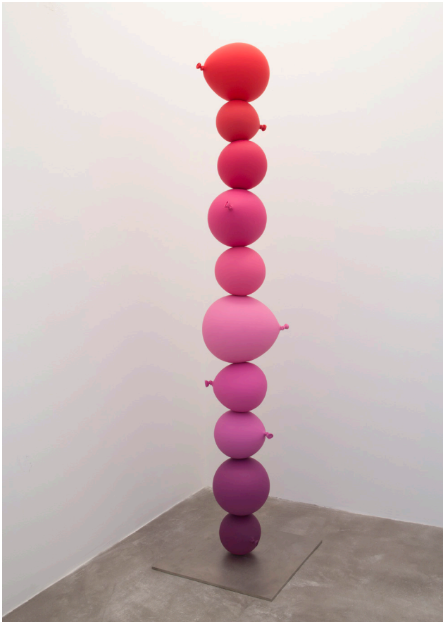
GIMHONGSOK, Ten Breaths , resin, 26 x 27 x 160,5 cm, 2015