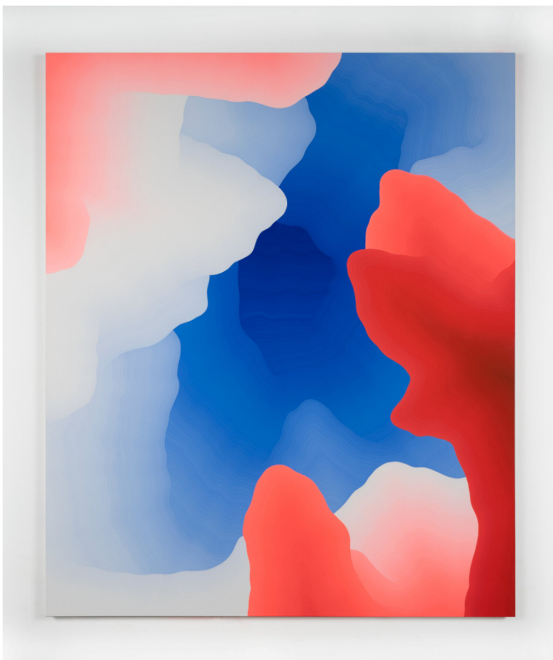
Το ακρυλικό του Σαμ Φρίντμαν

Με τη ρευστότητα του χρώματος που μοιάζει ακόμη νωπό, αποτυπώνεται αυτή η φανταστική φυγή στο μακρινό ιδυλλιακό νησί, η ρομαντική ιδεοθύελλα γύρω από την εξειδανίκευση του βίου μέσα στο άχρονο φυσικό περιβάλλον.