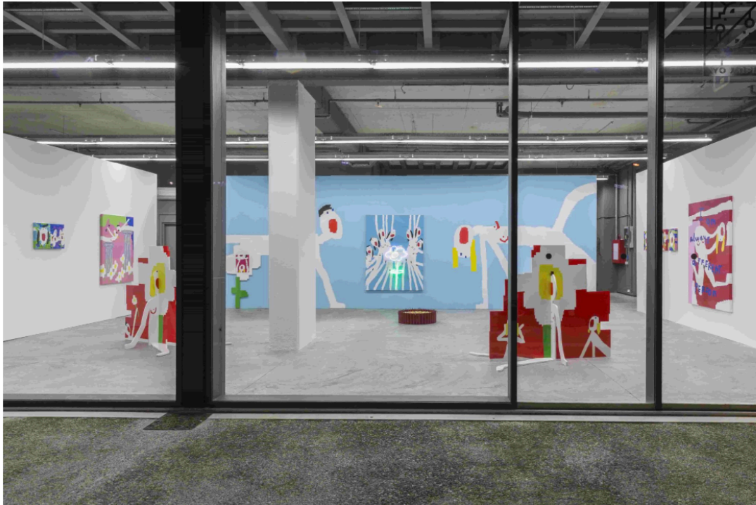
Maja Djordjevic, I'm Always a Different Person , εξωτερική άποψη εγκατάστασης