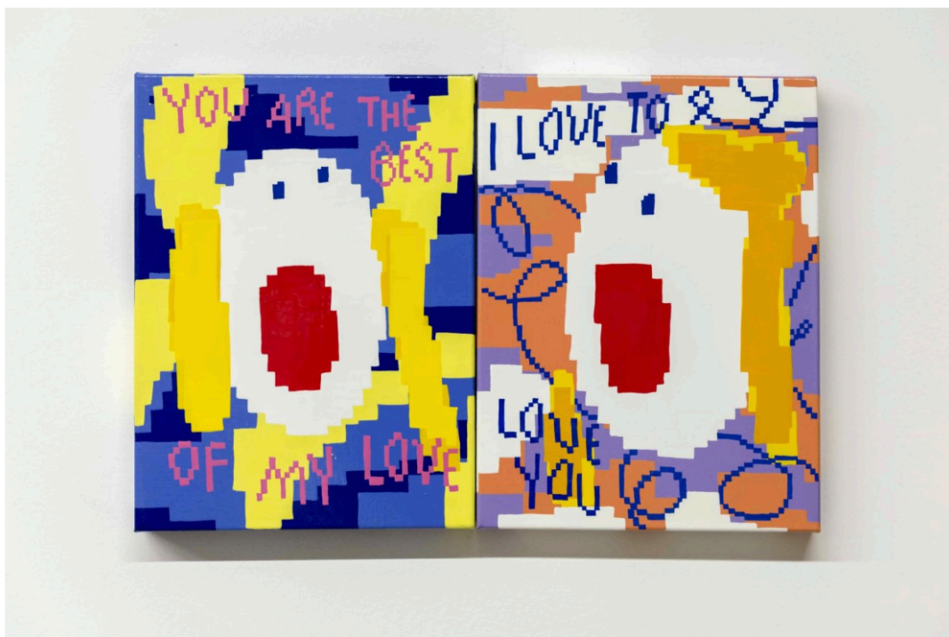
Maja Djordjevic, You Are The Best of My Love - I Love To Love You , 2019, Oil and Enamel on Canvas, 80 x 60 x 3 cm (40 x 30 x 3cm each)

Η ΕΙΚΑΣΤΙΚΟΣ ΜΑJA DJORDJEVIC ΓΙΟΡΤΑΖΕΙ ΤΟΝ ΕΡΩΤΑ ΚΑΙ ΜΑΖΙ ΤΟΥ ΟΛΕΣ ΤΙΣ ΠΡΟΚΛΗΣΕΙΣ ΤΗΣ ΖΩΗΣ.